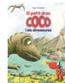
El petit drac Coco... Ingo Siegner