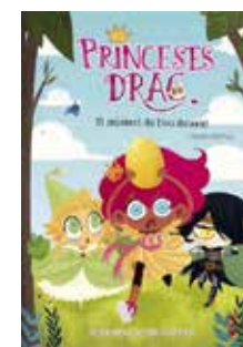
Princeses Drac. El misteri... Pedro Mañas