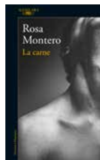
La carne Rosa Montero