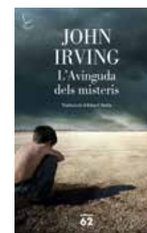
L'avinguda dels misteris John Irving