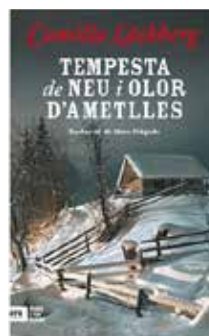
Tempesta de neu i olor... Camilla Läckberg