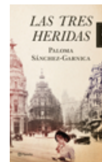
Las tres heridas Paloma Sánchez-Garnica