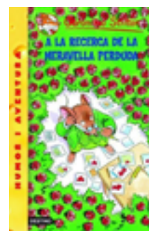
A la recerca de la... Geronimo Stilton