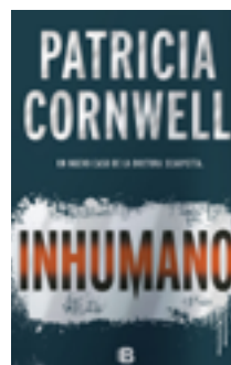
Inhumano Patricia Cornwell