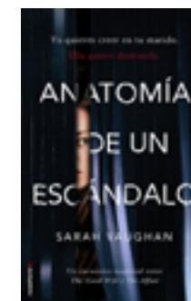
Anatomía de un escándalo Sarah Vaughan