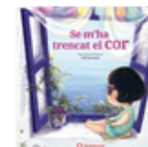
Se m'ha trencat el cor Elif Yemenici