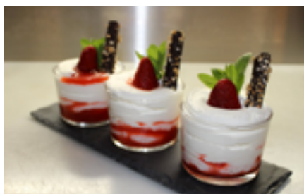
Recepta i imatge: www.lacuinadesempre.cat

Poseu una base de coulis al fons dels vasos. Ompliu el vaset amb la nata muntada, deixant un forat al mig. Ompliu aquest forat amb més coulis i decoreu amb una maduixa i alguna peça de xocolata.