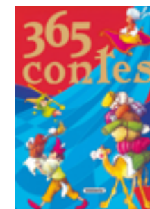
365 contes Contes de sempre