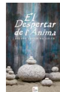
El despertar de l'ànima Dolors Coromina