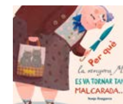
Per què la senyora... Sonja Bougaeva