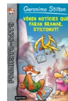
Vénen notícies que faran... Geronimo Stilton