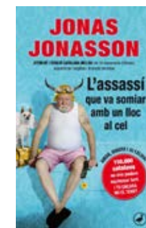
L'assassí que va somiar... Jonas Jonasson