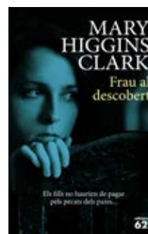
Frau al descobert Mary Higgins Clark