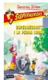
Supernesquitt i la pedra lunar Geronimo Stilton