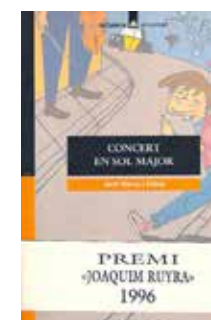
Concert en sol major Jordi Sierra i Fabra