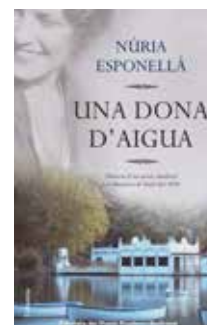
Una dona d'aigua Núria Espotellà