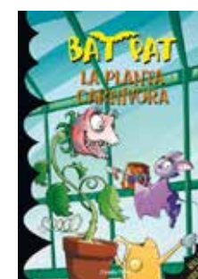
La planta carnívora Bat Pat