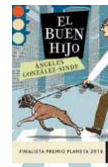
El buen hijo Ángeles González-Sinde