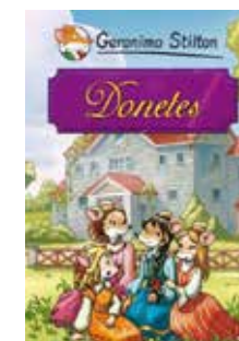
Donetes Geronimo Stilton