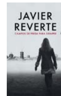
Campos de fresas para siempre Javier Reverte