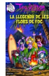
La llegenda de les... Tea Stilton