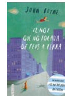
El noi que no tocava de... John Boyne