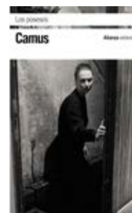
Los posesos Albert Camus