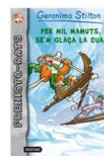
Per mil mamuts, se'm glaça la cua! Geronimo Stilton