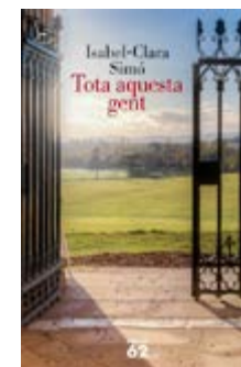
Tota aquesta gent Isabel-Clara Simó