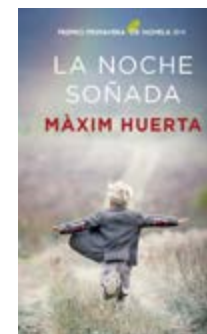
La noche soñada Màxim Huerta