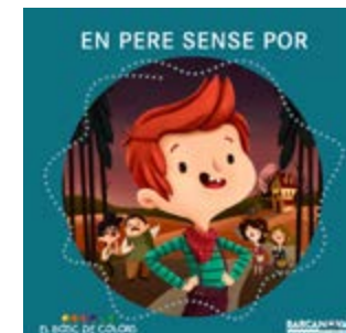
En Pere sense por Estel Baldó