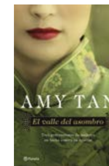
El valle del asombro Amy Tan