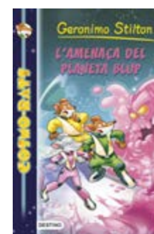
L'amenaça del planeta blup Geronimo Stilton