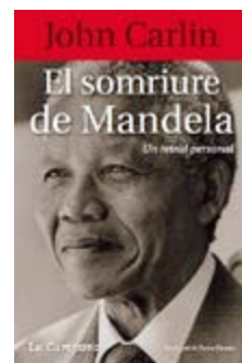
El somriure de Mandela John Carlin