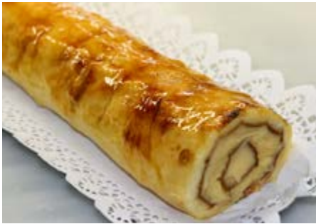
Recepta i imatge: www.lacuinadesempre.cat

Elaboració: és recomanable que la planxa de pa de pessic i la crema pastissera siguin fetes un dia o unes hores abans. El primer que cal fer és posar a escalfar la gelatina de poma. Poseu-ne una bona quantitat en un cassó i afegiu-hi un 20-30% d'aigua. Poseu-ho al foc i quan arrenqui el bull, deixeu-ho un parell de minuts i ho retireu. Reseuu-ho. Agafeu el paper de cocció i treballeu la planxa de pa de pessic a sobre mateix, retalleu una mica les cantonades i escampeu-hi una bona quantitat de crema.