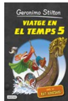
Viatge en el temps 5 Geronimo Stilton