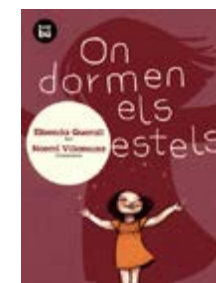
On dormen els estels? E. Queralt / N. Villamuza