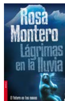
Lágrimas en la lluvia Rosa Montero