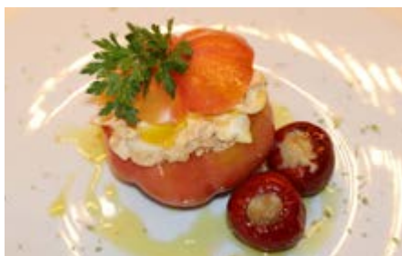
Recepta i imatge: www.lacuinaledesempre.cat

Elaboració: primer poseu a bullir els tres ous i quan estiguin refredeu-los amb aigua freda, peleu-los i reserveu-los. Renteu els tomàquets i feu-los un tall a la part superior que serveixi com a tapa. Amb la punta del ganivet, talleu el contingut carnós del centre del tomàquet i renteu-lo per dins per eliminar totes les llavors. Torneu a col·locar les tapes i reserveu els tomàquets. Obriu un pot de bonítol en oli d'oliva. Col·loqueu el bonítol en un bol, poseu-hi l'ou dur i talleu-ho tot plegat, sense esmicolar-ho en excés.