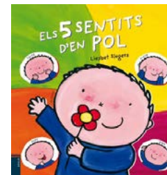
Els 5 sentits d'en Pol Liesbet Slegers