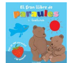
El gran llibre de paraules Timunmas