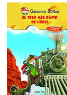
El tren més ràpid de l'oest Geronimo Stilton