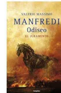
Odiseo. El juramento V. M. Manfredi