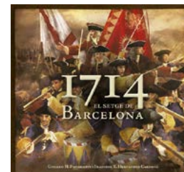
1714 El setge de Barcelona G. H. Pongiluppi i F.X. Hernández