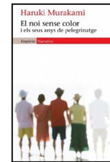
El noi sense color i els seus... Haruki Murakami