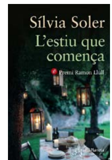
L'estiu que comença Sílvia Soler