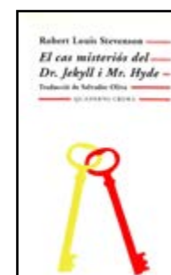
El cas misteriós del Dr. Jekyll... Robert Louis Stevenson