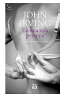
En una sola persona John Irving