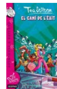
El camí de l'èxit Tea Stilton