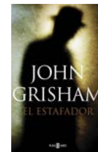
El estafador John Grisham