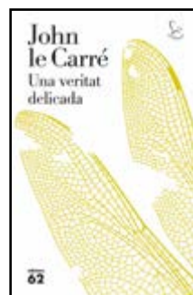
Una veritat delicada John le Carré