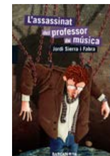
L'assassinat del professor... Jordi Sierra i Fabra