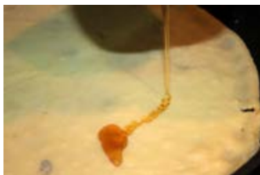
Crep de mel

Dos ous, 125 grams de farina, 1/4 de litre de llet, una cullerada de sucre, mantega i un pessic de sal. Si farciu les creps amb dolços, podeu afegir-hi un polsim de vainilla o canyella a la massa.