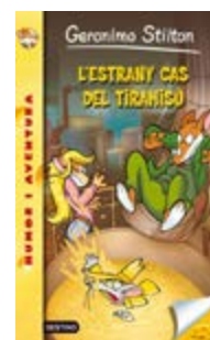
L'estrany cas del tiramisú Geronimo Stilton