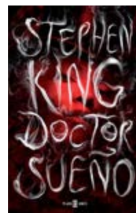
Doctor sueño Stephen King