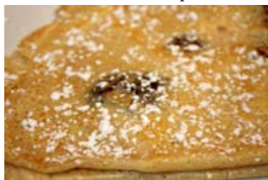
Crep de xocolata