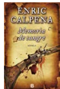
Memòria de sangre Enric Calpena