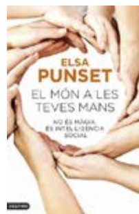
El món a les teves mans Elsa Punset