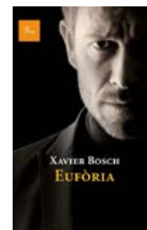
Eufòria Xavier Bosch