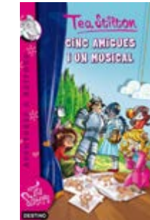
Cinc amigues i un musical Tea Stilton