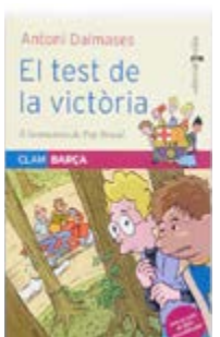
El test de la victòria Antoni Dalmases