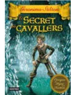
El secret dels cavallers Geronimo Stilton