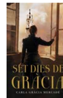
Set dies de Gràcia Carla Gràcia