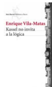
Kassel no invita a la lògica Enrique Vila-Matas