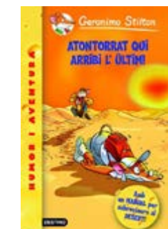
Atontorrat qui arribi l'últim! Geronimo Stilton