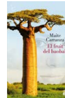
El fruit del baobab Maite Carranza