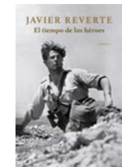
El tiempo de los héroes Javier Reverte