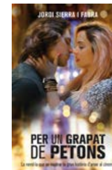
Per un grapat de petons Jordi Sierra i Fabra