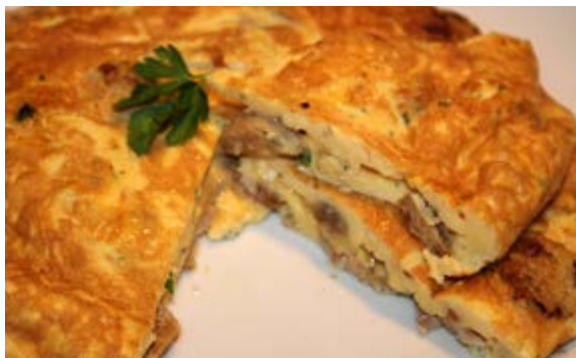
Recepta i imatge: www.lacuinadesempre.cat

Talleu la botifarra a rodanxes i piqueu la cansalada a daus petits. Barregeu bé tots els ous en un bol. No només s'han de barrejar, sinó que s'han d'emulsionar una mica, fins que veieu que surten bombolles pels costats. Així us quedarà la truita més esponjosa. Piqueu l'all amb el julivert, ben petit, i en una paella antiadherent amb un raig d'oli salteu la botifarra. Quan hagi agafat una mica de color incorporeu-hi la cansalada i ho remeneu tot plegat. Afegiu l'all i julivert i les mongetes cuites si voleu. Aproveiteu per salar una mica els ous batuts i quan tot tingui color els afegiu a la paella. Deixeu que vagi coent poc a poc i doneu-li la volta. Ja la podeu servir.