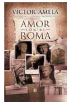
Amor contra Roma Víctor Amela