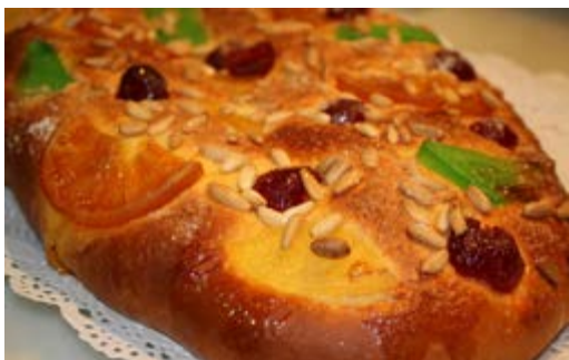
Recepta i imatge: www.lacuinaadesempre.cat

Elaboració: prepareu la fuita confitada, el sucre i els pinyons. Pasteu el brioiix, sobretot que tingui una bona elasticitat. Deixeu-lo reposar 10 minuts abans d'estirar-lo i doneu-li una forma ovalada. Ara decoreu la coca enganxant bé les fruites, apretant sense por, i deixeu que llevi la massa (de 2 a 3 hores). L'heu de deixar en un lloc sec i sense corrent d'aire, per exemple dins el forn. Passades unes hores, veureu com la massa ha augmentat el triple. Bateu un ou i pinteu-la amb molta cura de no abaixar-la. Procureu no fer-ho, però no passa res si també pinteu la fruita. Tot seguit, tireu una bona quantitat de pinyons per sobre de tota la coca i també sucre en abundància. Prepareu el forn entre 180-200° C sense ventilació i enforneu-la durant uns 12-15 minuts. Vigileu-la bé perquè el brioiix es crema amb molta facilitat. Quan estigui llesta, podeu tirar-hi un rajet d'anís per sobre. Deixeu-la refredar una mica abans de servir però que no li toqui l'aire.