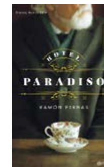
Hotel Paradiso Ramón Pernas