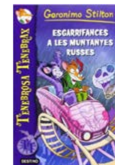
Esgarrifances a les... Geronimo Stilton