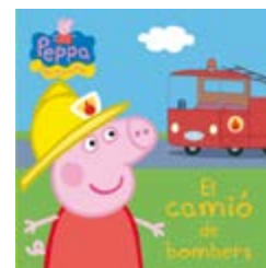
El camió de bombers Peppa