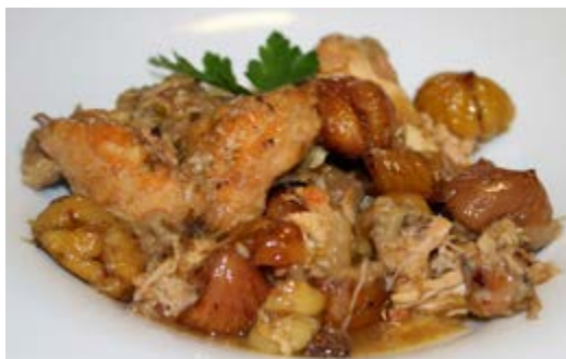
Recepta i imatge: www.lacuinadesempre.cat

Talleu el pollastre a trossos mitjans per rostir. Peleu una mica la cabeça d'all i feu-hi talls amb el ganivet, i després trinxeu la ceba a trossos grans. Saleu i empebreu el pollastre i poseu-lo en una cassola amb força oli. Un cop estigui daurat, retireu l'excés d'oli i afegiu-hi la ceba, l'all i l'orenga. Tireu-hi el raig de vi blanc i tapeu la cassola durant uns 15 minuts a foc lent. Després, afegiu-hi l'aigua bullint (un litre més o menys) i saleu-ho tot plegat. Trigarà entre 60 i 80 minuts a coure's, depenent del tipus de pollastre. Quan faltin 15 minuts per acabar la cocció, afegiu-hi les castanyes i deixeu que s'acabi de fer tot plegat.