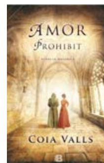
Amor prohibit Coia Valls