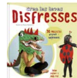
Crea les teves disfresses Beatriz de Rivera