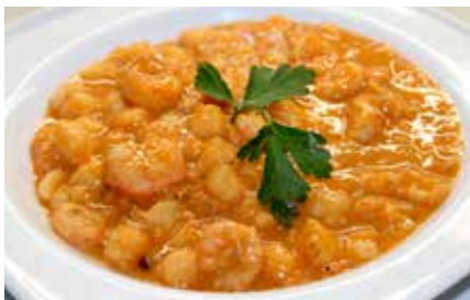
Recepta i imatge: www.lacuinaadeseembre.cat

Saleu i empebreu els llagostins, i salteu-los en una paella amb oli ben calent. Afegiu-hi conyac i flamegeu-los amb compte. Quan el sofregit sigui ben intens, afegiu-hi els llagostins, els cigrons cuits i la picada. Remeneu-ho i aboqueu-hi el brou calent fins que ho cobreixi tot. Rectifiqueu de sal i deixeu-ho coure tot junt durant uns 10-15 minuts. Convé deixar-ho reposar una estona, fins i tot, unes hores.