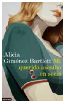
Mi querido asesino... en serio Alicia Giménez Bartlett