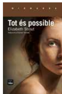
Tot és possible Elizabeth Strout