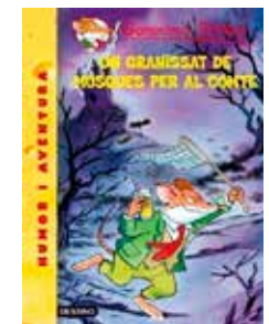
Un granissat de mosques... per al pante Geronimo Stilton