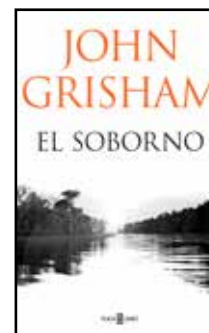
El soborno John Grisham