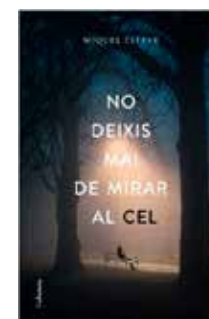
No deixis mai de mirar al cel Miquel Esteve