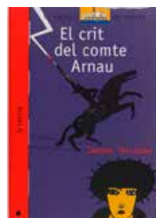
El crit del comte Arnau Jaume Terrades